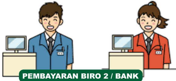
PEMBAYARAN BIRO 2 / BANK

Biro Administrasi Akademik (BIRO 1) | email: biro1@staff.ukdw.ac.id | Phone: 0274 - 563929 ext 111