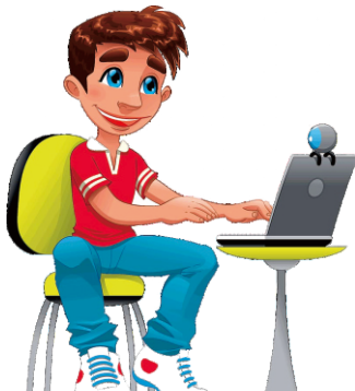
AKSES PORTAL pmb.ukdw.ac.id/admisi